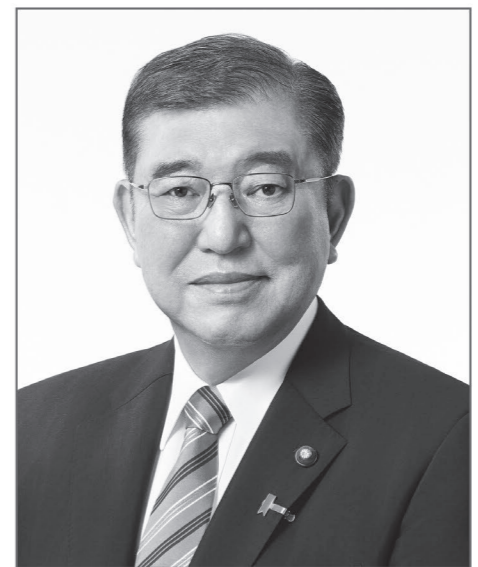
自由民主党総裁 石破 茂