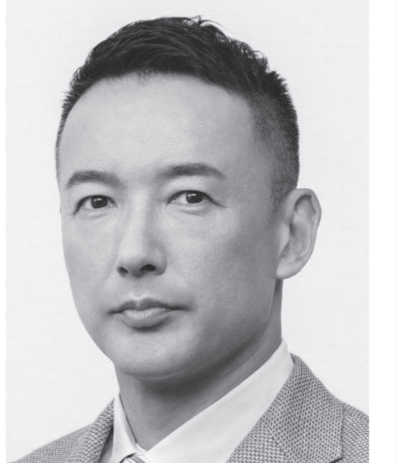
れいわ新選組 代表 山本太郎