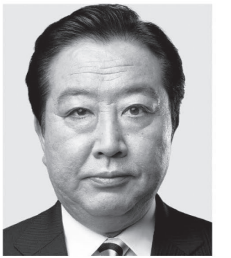
▲立憲民主党 ウェブサイト