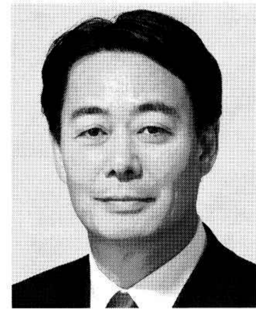
民主党代表 海江田万里