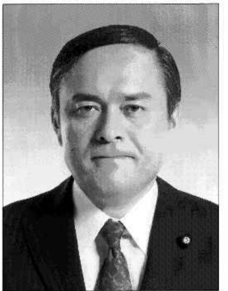
社民党党首 吉田 忠智