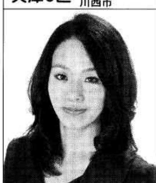
すぎた 水脈 みづな 水脈