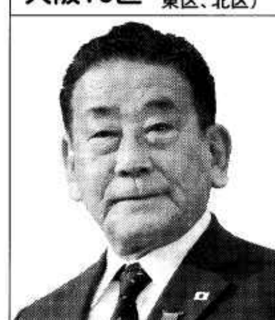
西村 真悟 にしむら しんご