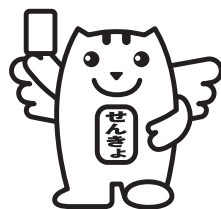
選挙の「めいすいくん」

※選挙公報の掲載順は、くじによって決められたものです。立候補の届出順とは異なる場合があります。