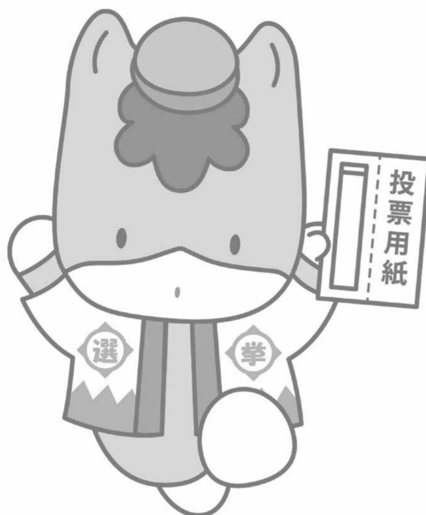
群馬県のマスコット「ぐんまちゃん」