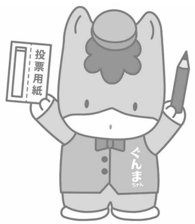
群馬県のマスコット「ぐんまちゃん」