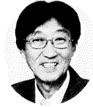
日本共産党 おおつき和弘 かずひろ