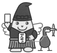
岐阜県明るい選挙推進 イメージキャラクター 鶯飼めいすいくん