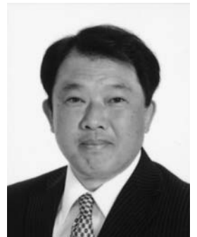
無所属 やまがた 山形 としひろ 昭和四十五年二月九日生 四十七歳