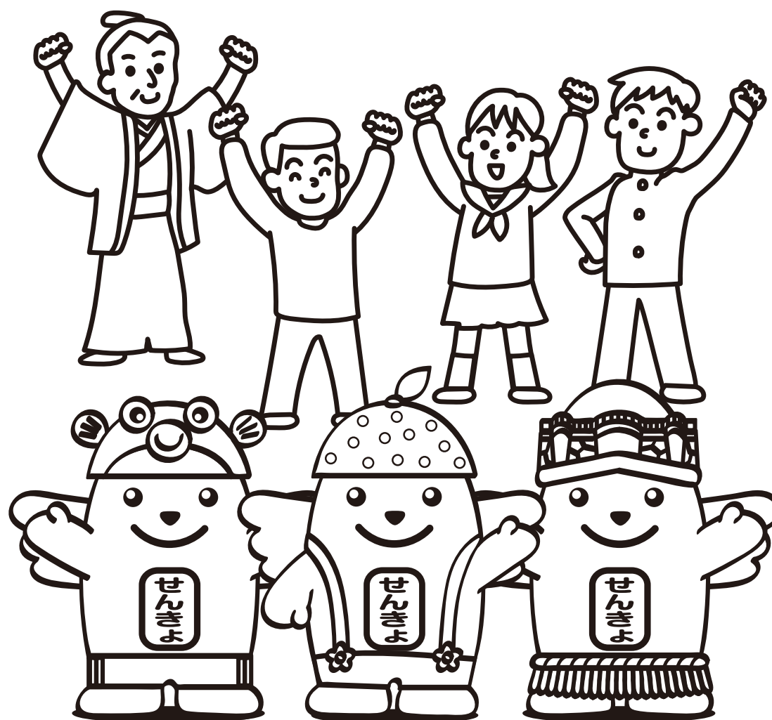
めいすいくんスマイル隊