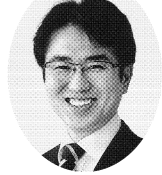
【プロフィール】 弁護士・税理士 1974年11月23日生まれ。創価大学法学部卒業。 経歴=2002年 司法試験合格 2004年 弁護士登録 2012年 衆議院議員選挙 初当選 2014年 衆議院議員選挙 当選(2期目) 大阪弁護士会所属、近畿税理士会所属 役職=党国会対策副委員長、党法務部長 家族構成=妻、一男一女