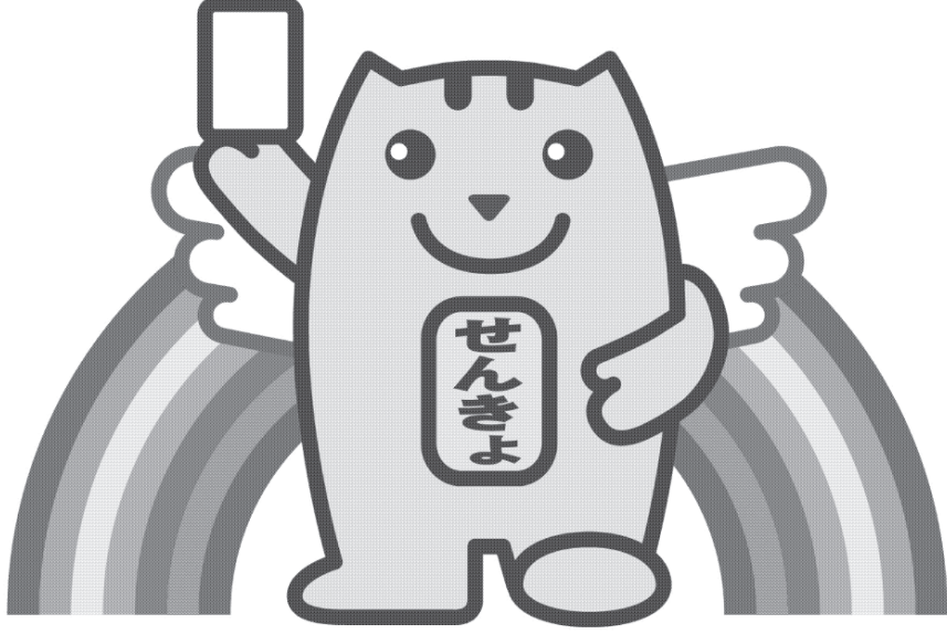
明るい選挙キャラクター 選挙のめいすいくん