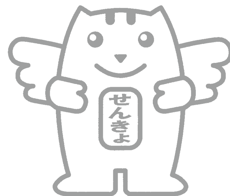
「選挙のめいすいくん」

場所：市役所東館 1階市民ホール、 赤堀支所、あずま支所、 境支所、豊受公民館、 市民サービスセンター宮子(午前10時～午後8時まで) 伊勢崎駅前(午前10時～午後8時まで)