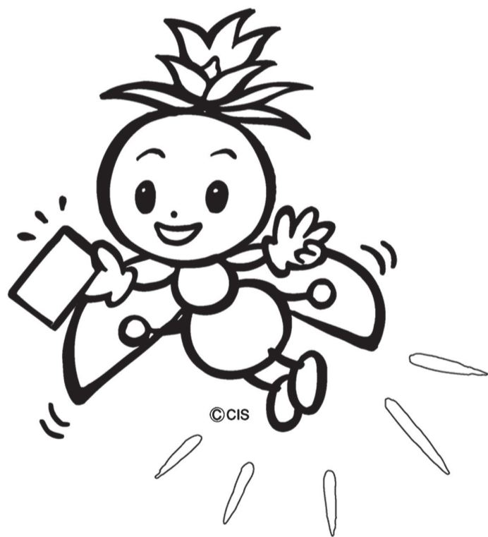
長野県選挙啓発マスコットキャラクター ほたりちゃん

仕事や旅行などの理由で、投票日当日に投票できない方は、 8月4日(土)まで期日前投票ができます