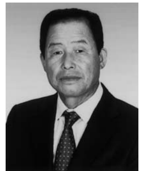
昭和二十三年七月二十三日 (七十歳)