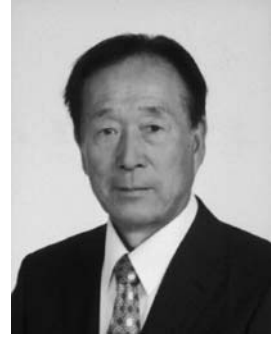
昭和二十九年二月二十五日生 六十四歳

塩谷広域行政組合ごみ処理場建設・運営費が、全国平均比で100億円以上高いことを指摘。「適正な進め方による大幅なコスト削減策」を目的としフォーラムを自ら企画して開き、入札方法の問題点や予算の不適正さを追及。「ごみ処理施設新体制を求める議員の会」を結成し管理責任者への要望書を提出。議会で否決され予算の見直しが決定し、10年以上も指摘されなかった案件について、税金数十億円の無駄遣いにストップをかけることができました。