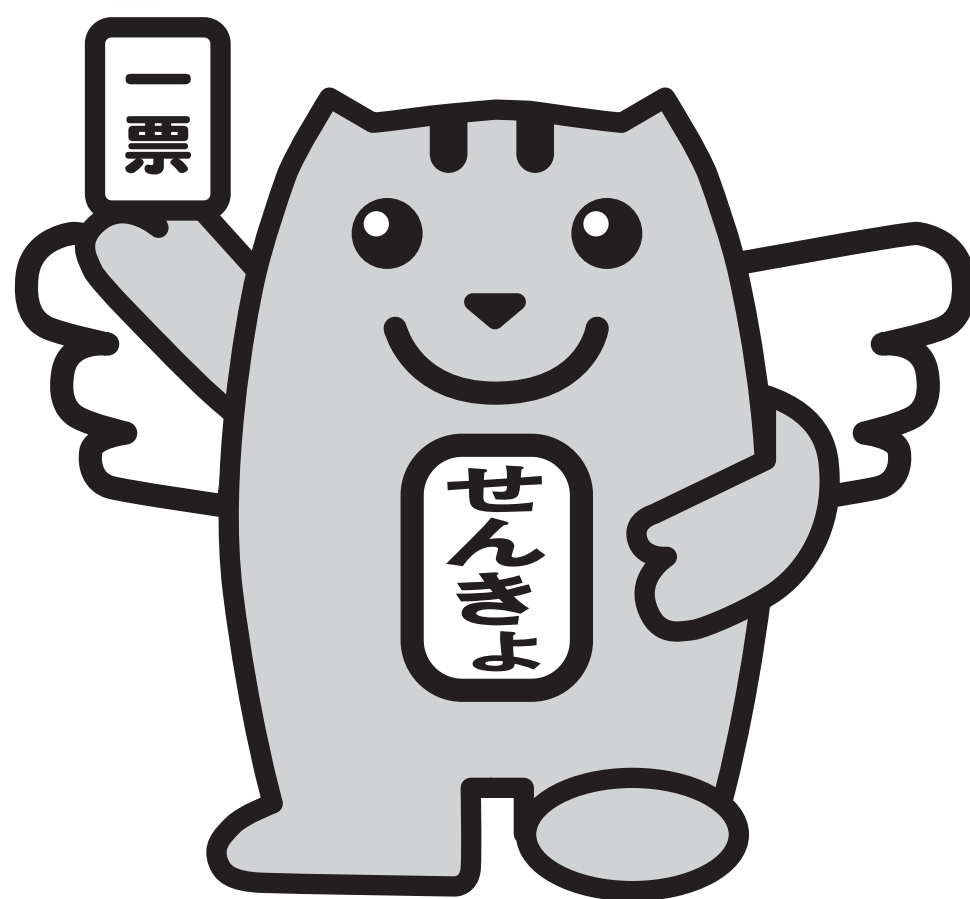
明るい選挙のめいすいくん