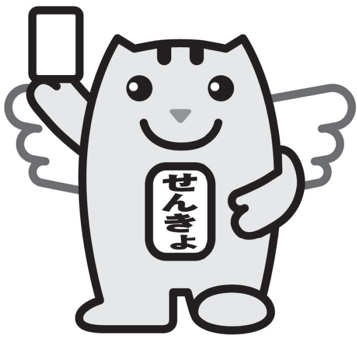
選挙のめいすいくん