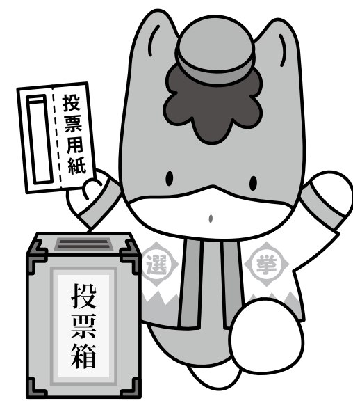
群馬県のマスコット「ぐんまちゃん」