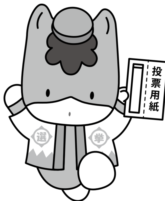
群馬県のマスコット「ぐんまちゃん」