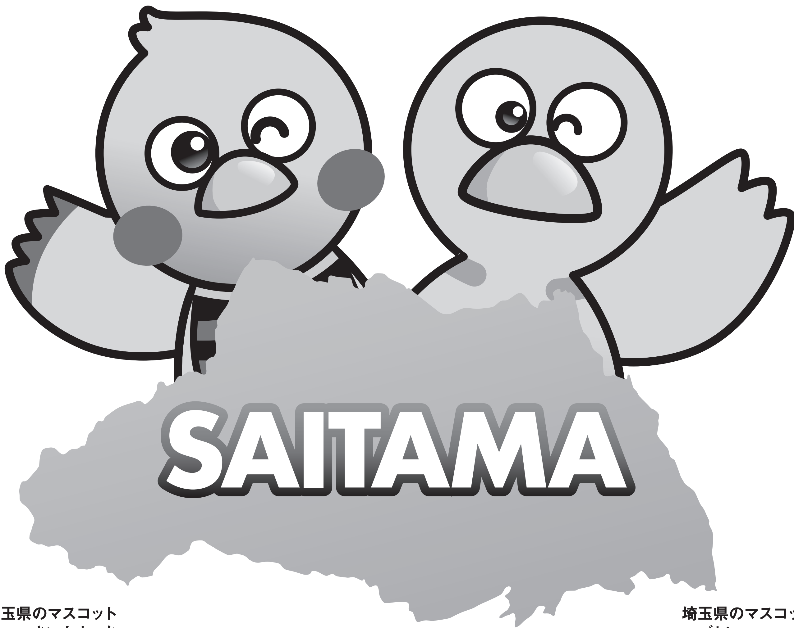
埼玉県のマスコット さいたまっち