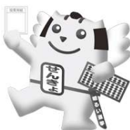
明るい選挙イメージキャラクター 愛称：ひやくまんこっくん