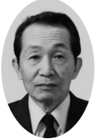
えちご けん 明 (70歳)