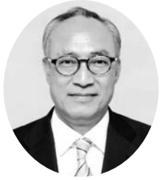
大野城市議会議員一般選挙候補者 公明党公認