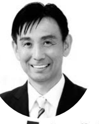
大野城市議会議員一般選挙候補者 公明党公認