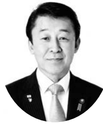
大野城市議会議員候補（自民党公認）