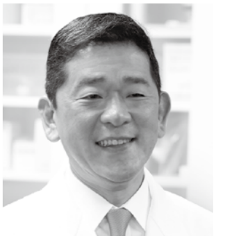
自由民主党 参議院議員候補者

児童手当の給付対象拡充、大学等の経済的負担軽減を始め、教育と人への投資を積極的に推進します。シニア世代を守り、少子化に対応するためにも、社会保障と税の一体改革の着実な推進を図ります。「郷学郷就」ふるさとで学び、ふるさとで働くシステムを創ります。地方の活性化には、地域で自由に使える一括交付金の拡充復活による「地域主権」がどうしても必要です。地場産業の活性化と、農業者戸別所得保障制度の復活拡充を図るとともに、食の安心安全を推進します。非正規・正規・賃金・待遇の不公平をなくし、時給は1,000円以上を実現します。保育・介護・看護の分野の諸手当の改善と人材確保は急務です。憲法9条は世界に対する平和宣言であり、不戦の誓い。憲法の平和主義を断固堅持します。