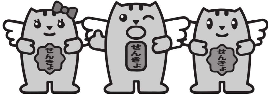
贈らない 求めない 受け取らない