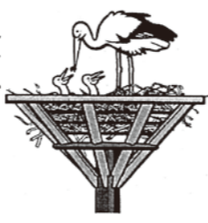
コウノトリの雛が誕生！

・小山市に生まれる。 ・栃木高校・京都大学・東京大学院修了。 ・農水省入省・外務省出向(中国大使館一等書記官として、トキの橋渡し役を務める)・岡山県庁出向・小山市長就任・再任。