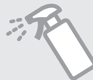
記載台・ 鉛筆の消毒