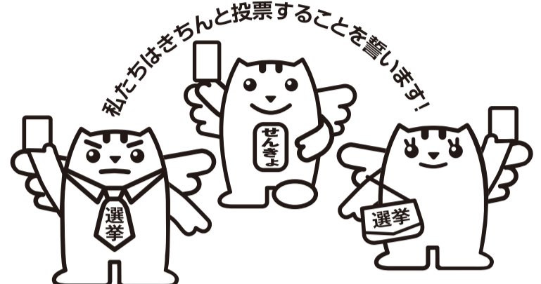
明るい選挙イメージキャラクター「選挙のめいすいくん」