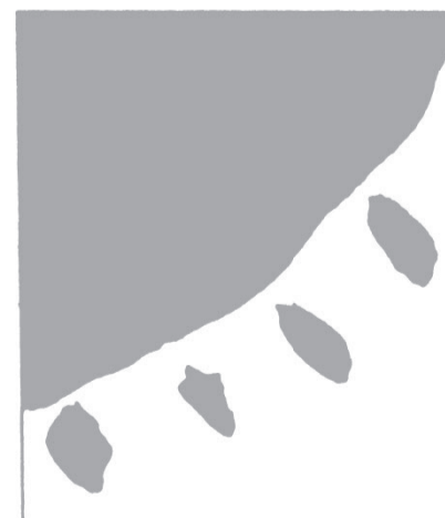
明るい選挙のシンボルマークです