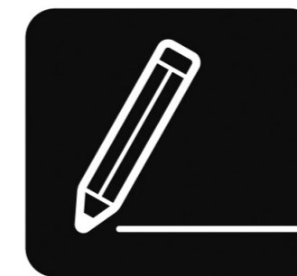
持参した鉛筆の 使用が可能