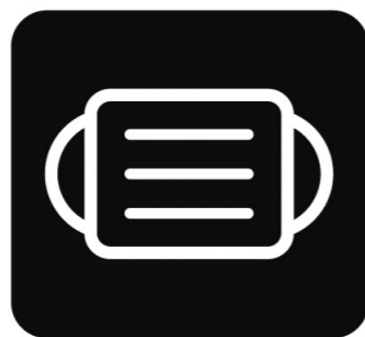
マスク着用 (咳エチケット)