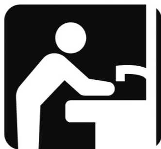
来場前後の手洗い