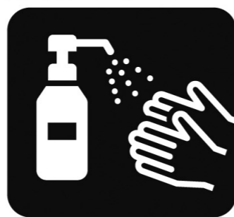
アルコール消毒液 の設置