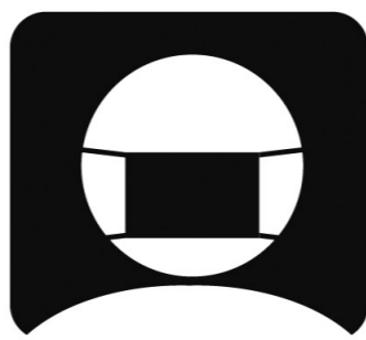
スタッフのマスク着用