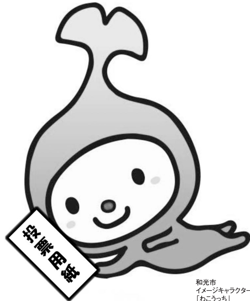
和光市 イメージキャラクター 「わこうち」