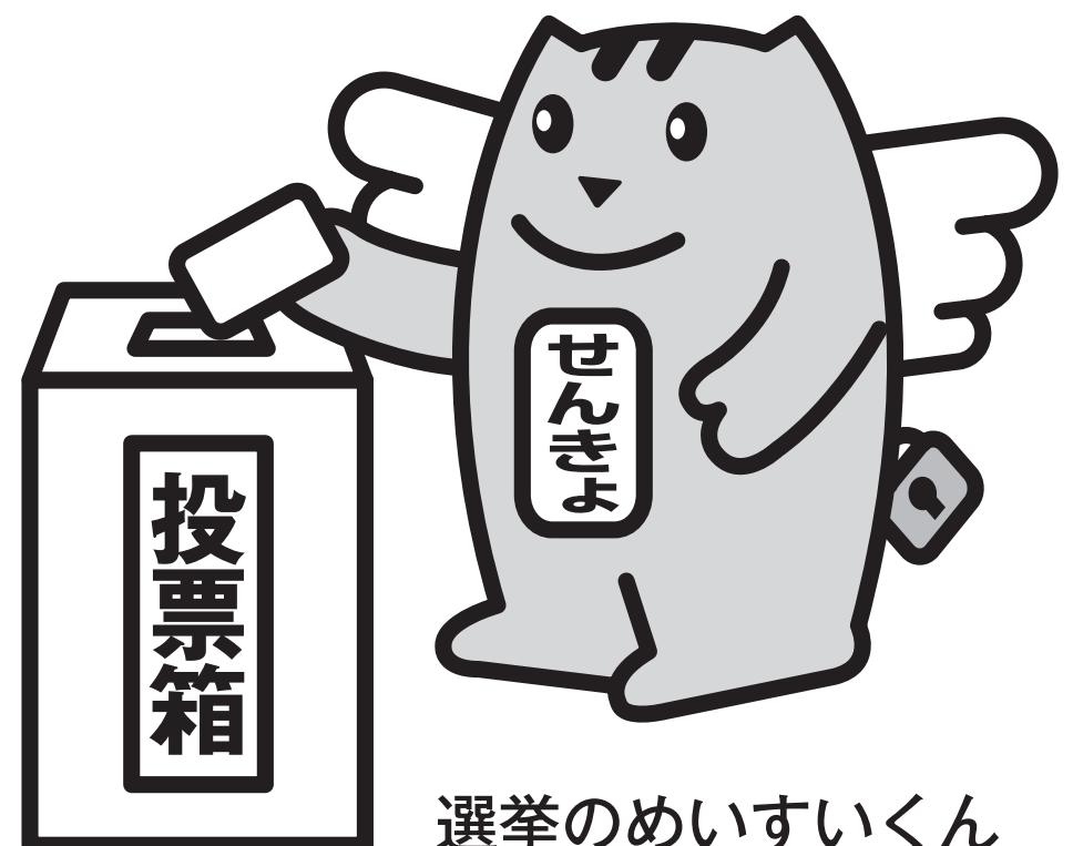
選挙のめいすいくん