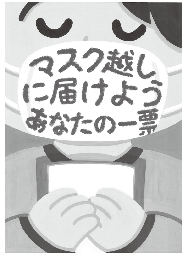
明るい選挙ポスターコンクール 香川県最優秀受賞作品 (三木ちさとさんの作品)

◎投票時間は午前7時から午後8時までです。(一部の投票所では、この時間が変更されていますからご注意ください。)