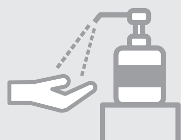
アルコール 消毒液の設置