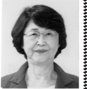
北九州市議会議員候補 公明党公認