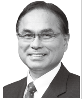
(昭和24年1月12日生まれ、潤ヶ野小学校、出水中学校、有明高等学校卒)