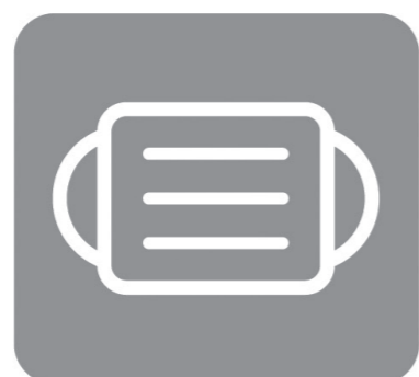
マスク着用 (咳エチケット)