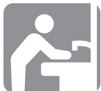
来場前後の手洗い