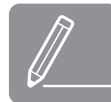
持参した鉛筆の 使用が可能