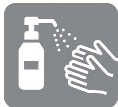
アルコール消毒液 の設置