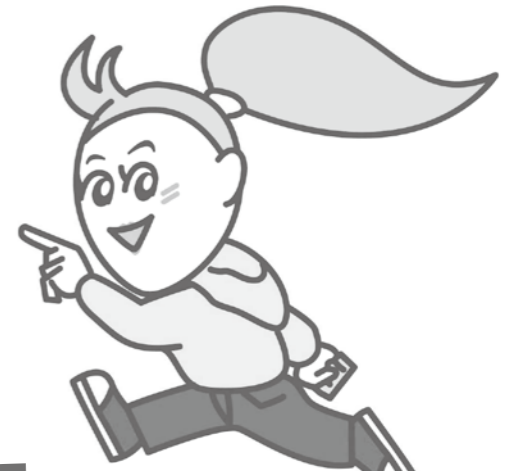
リッキー 選挙キャラクター